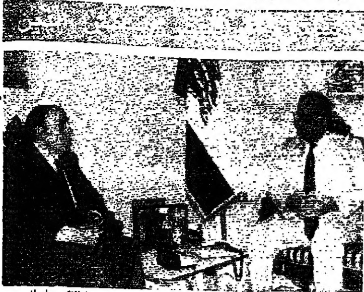
الرئيس الحص مقبلا السفير شاش (اليمين)